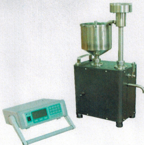
Рисунок 2 – Общий вид влагомеров сырой нефти лабораторных ВСН-Л-03